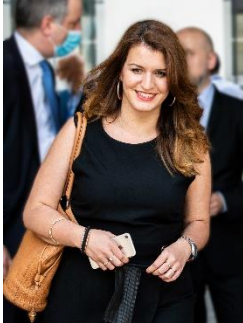
Marlène Schiappa Ministre déléguée auprès du ministre de l'Intérieur chargée de la Citoyenneté.

« Vivre sa citoyenneté, partager ses compétences ; quoi de plus généreux ? Le don de temps, le don de soi, illustre par l'exemple le rôle social des entreprises. C'est aussi s'engager pour des causes qui nous tiennent à cœur, pour le bien commun, pour donner du sens à ce que nous faisons au quotidien.